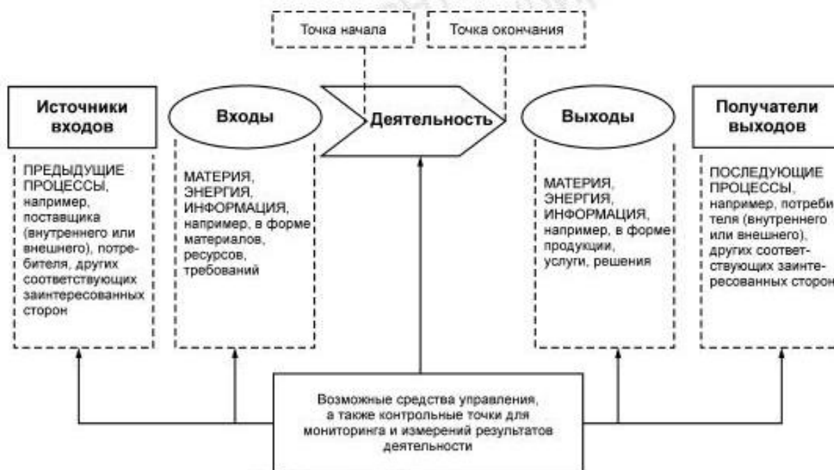
Рисунок 1 — Схематичное изображение элементов процесса

Рисунок 1 дает схематичное изображение любого процесса и иллюстрирует взаимосвязь элементов процесса. Контрольные точки мониторинга и измерения, необходимые для управления, являются специфическими для каждого процесса и будут варьироваться в зависимости от соответствующих рисков.